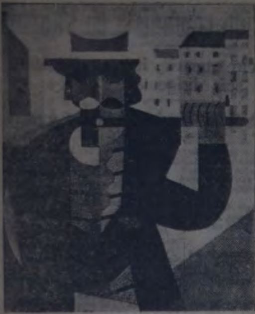
EL FLAUTISTA CIEGO

El caos en que se cree sumido al arte contemporáneo, es sólo aparente cuando se llega a establecer una justa demarcación de los propósitos de cada tendencia. Per otra parte, estas meteóricas transiciones tal vez conduzcan a un reposo bello y armonioso.